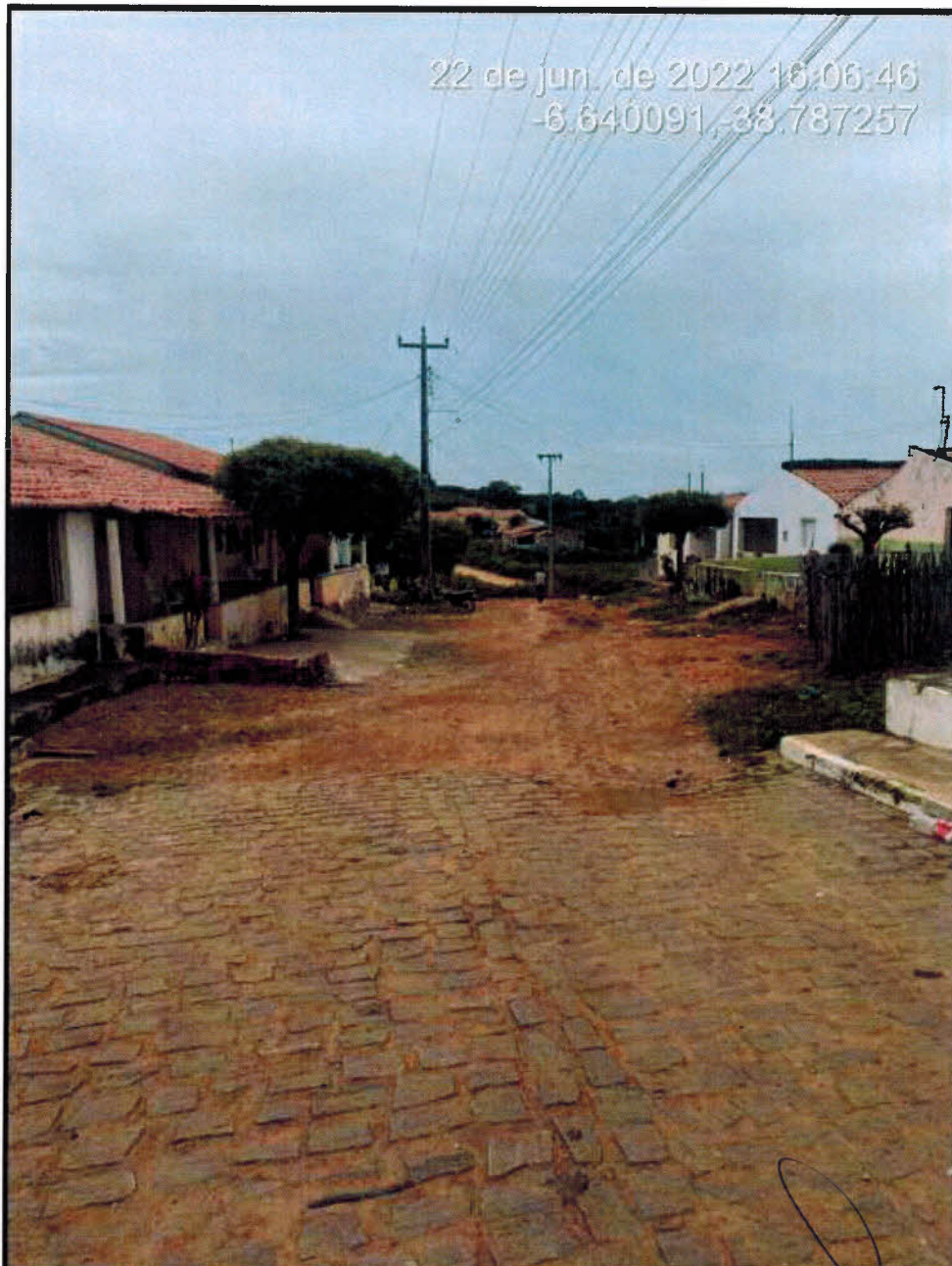
01 - INÍCIO DE PAVIMENTAÇÃO