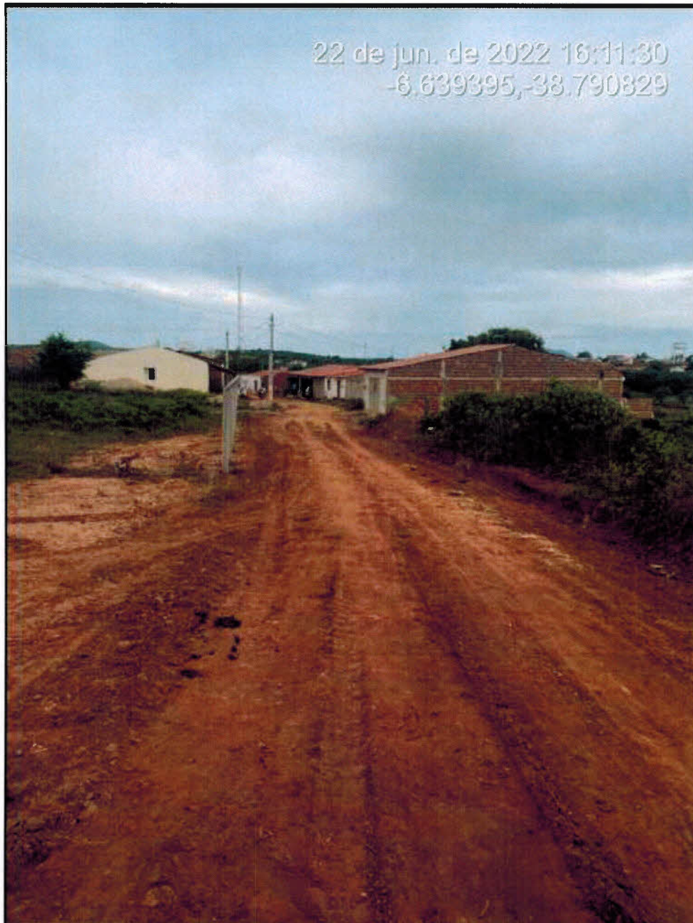
02 - FIM DE PAVIMENTAÇÃO